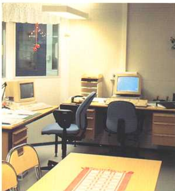
Flyttbara Rum som trivsamt kontor på lagret eller i produktionen.