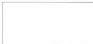
Gråvit, NCS 1000