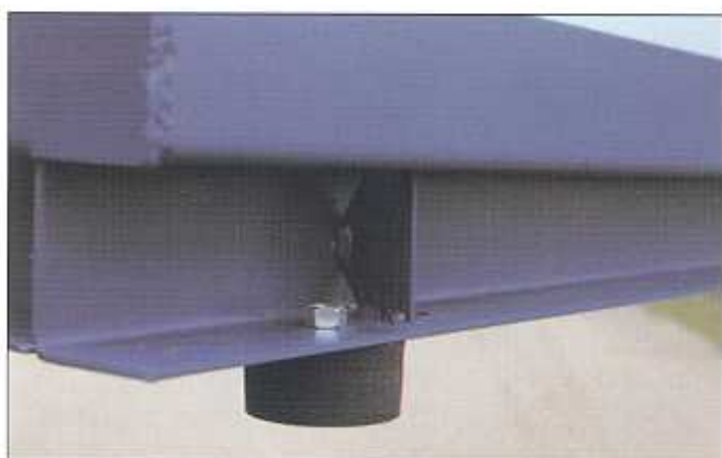
Vibrationsdämpande fötter i varje hörn.