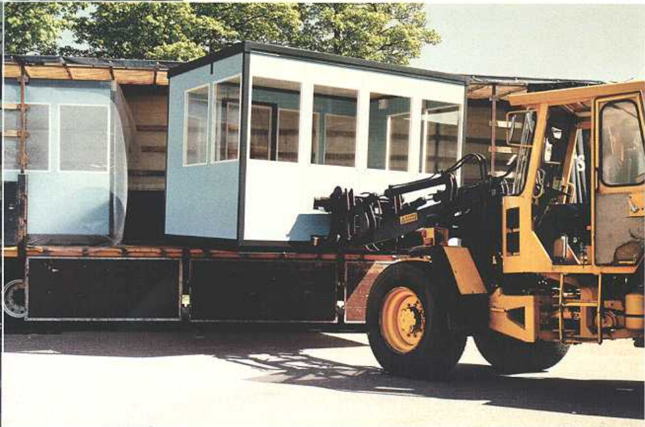
Flyttbara Färdiga Rum är lätta att placera i de flesta miljöer. Flyttas enkelt med gaffeltruck.