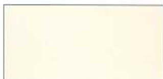
Ljusbeige, NCS 1005-Y20R