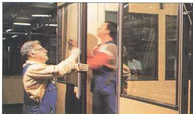
Fönster: 4 + 4 mm glas i aluminiumprofiler. Fönsterdörrar av stål med trycken och lås för ASSA-cylinder.