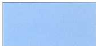
Ljusblå, NCS 1040-R90B