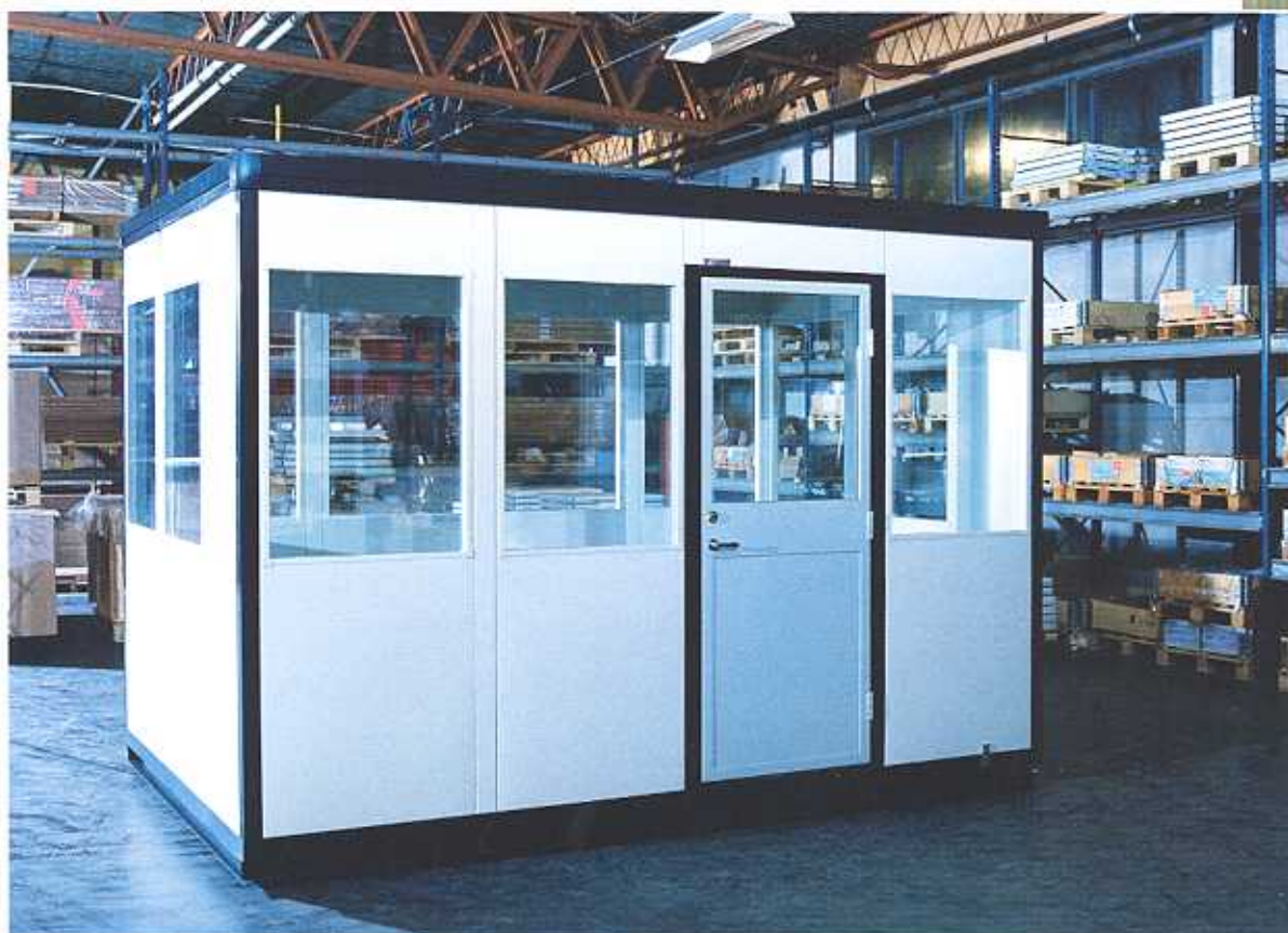
6.6 eller 8.8 m 2 golvyta. Som singelinstallation är totalhöjden 2.66 m.