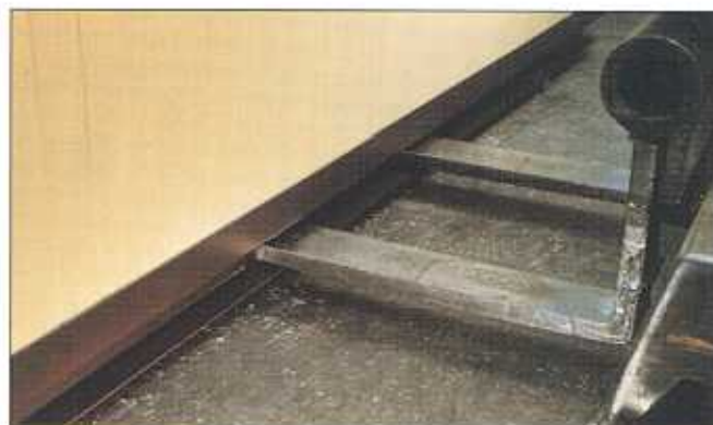
Flyttas lätt med gaffeltruck. Urtag för gafflarna i det svetsade stålunderredet.