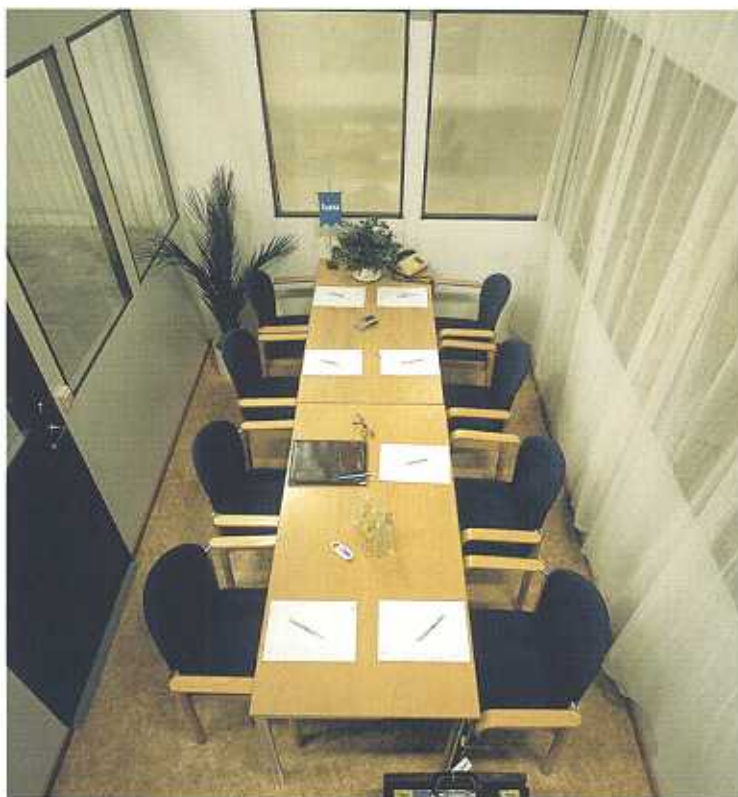
Effektiv arbetsplats, konferensrum eller trivsamt pausrum.