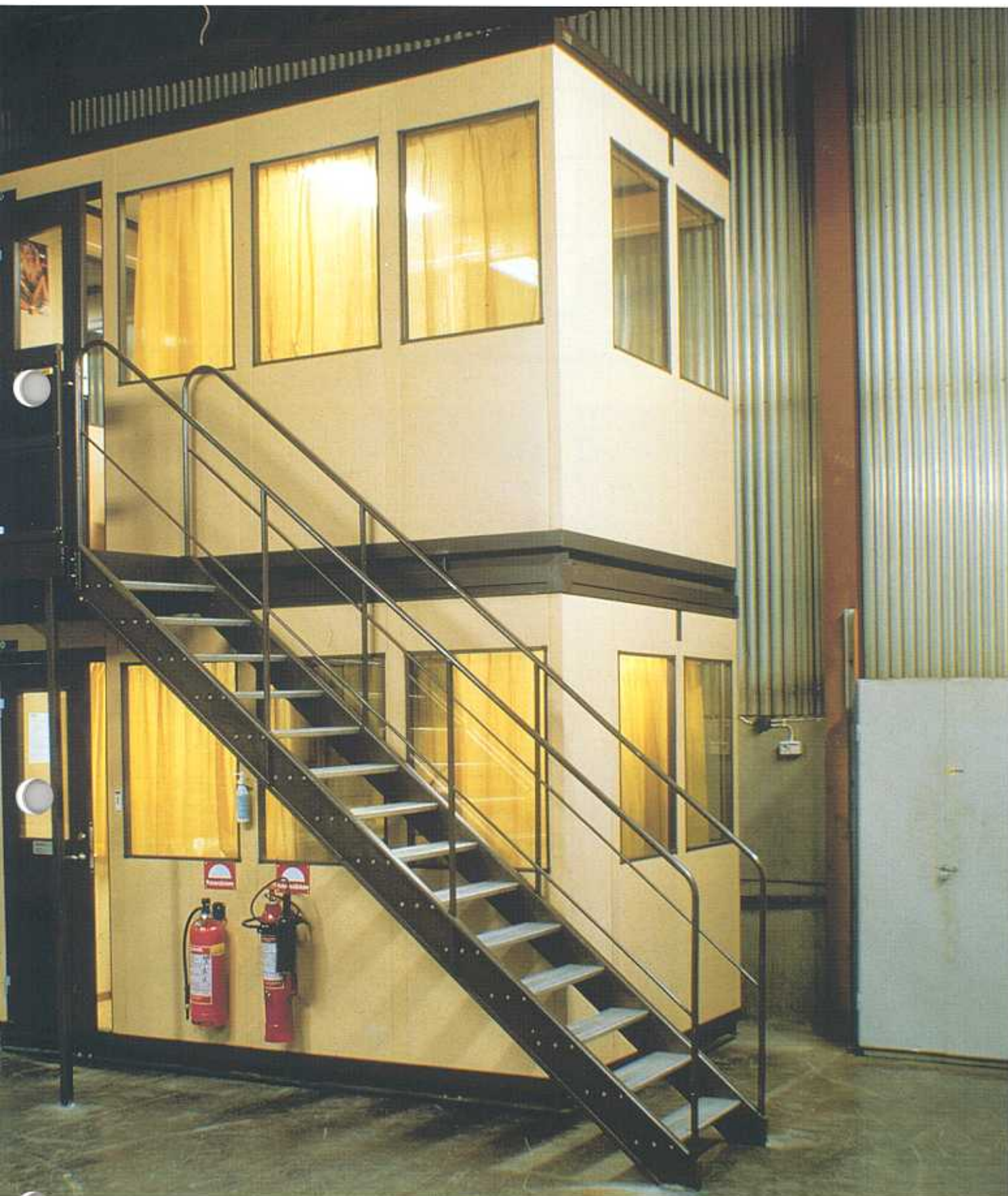
Som tvåvåningsinstallation ställs en enhet snabbt och enkelt ovanpå den andra med gaffeltruck. Förstärkningar, trappa med räcke och plattform ingår i leveransen.